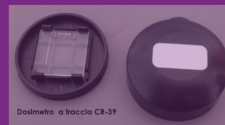
Dosimetro a traccia CR-39

Per ulteriori informazioni sul radon in generale: