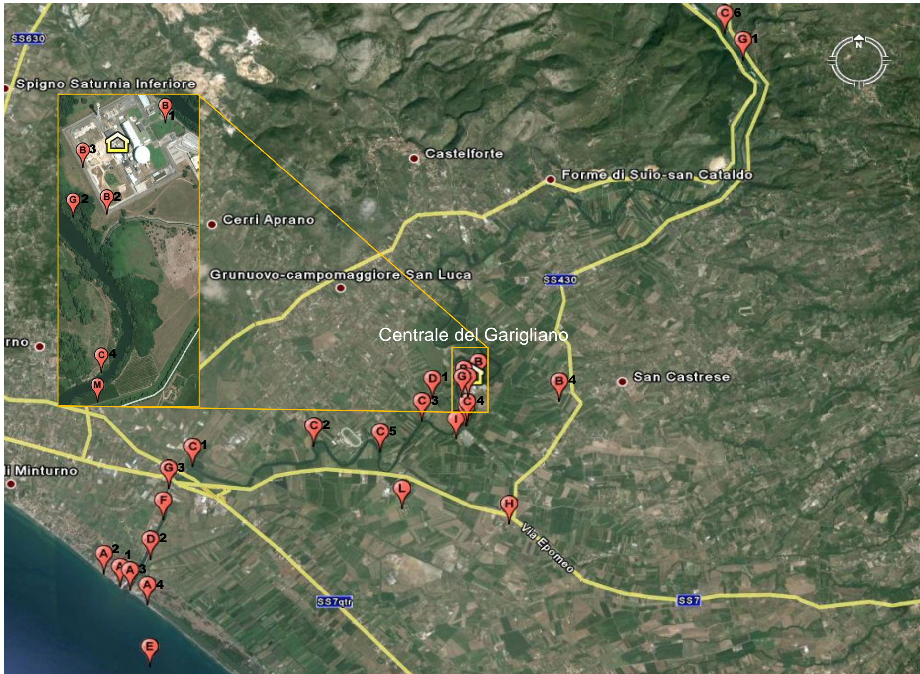
A: Sabbia di mare B: Acqua di falda C: Sedimenti fluviali D: Erba e terreno E: Acqua e pesce di mare F: Pesce di fiume G: Acqua di fiume H: Vegetali I: Frutta L: Latte di bufala M: Aria