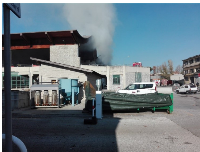
Campionatore alto volume presso impianto TMB

I valori di benzo(a)pirene misurati risultano superiori al limite annuale previsto dal d.lgs. n.155/2010.