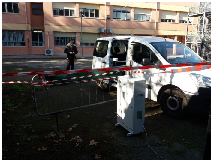
Campionatore presso la scuola